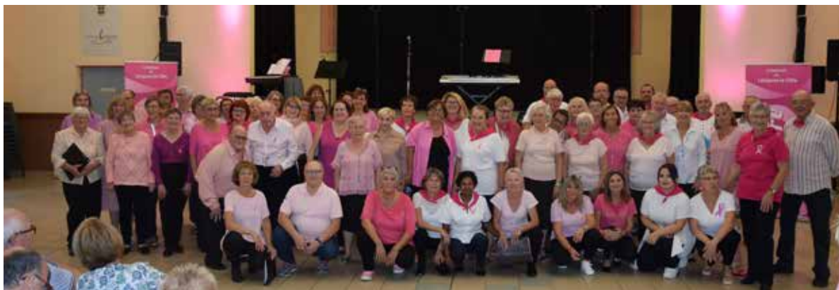
2 Chorales unies pour un concert de solidarité : Les Valrossignols, Léz Enchantés