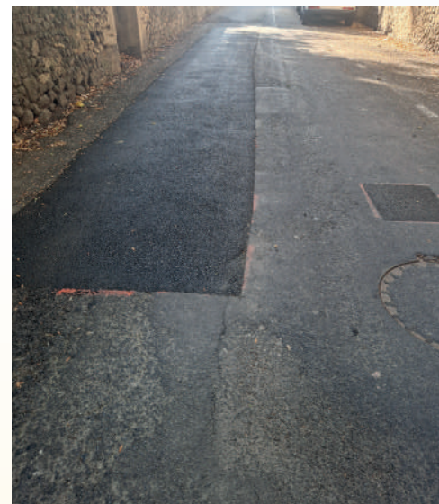
Réfection de chaussée