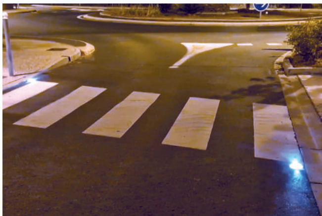
Sécurisation plots lumineux