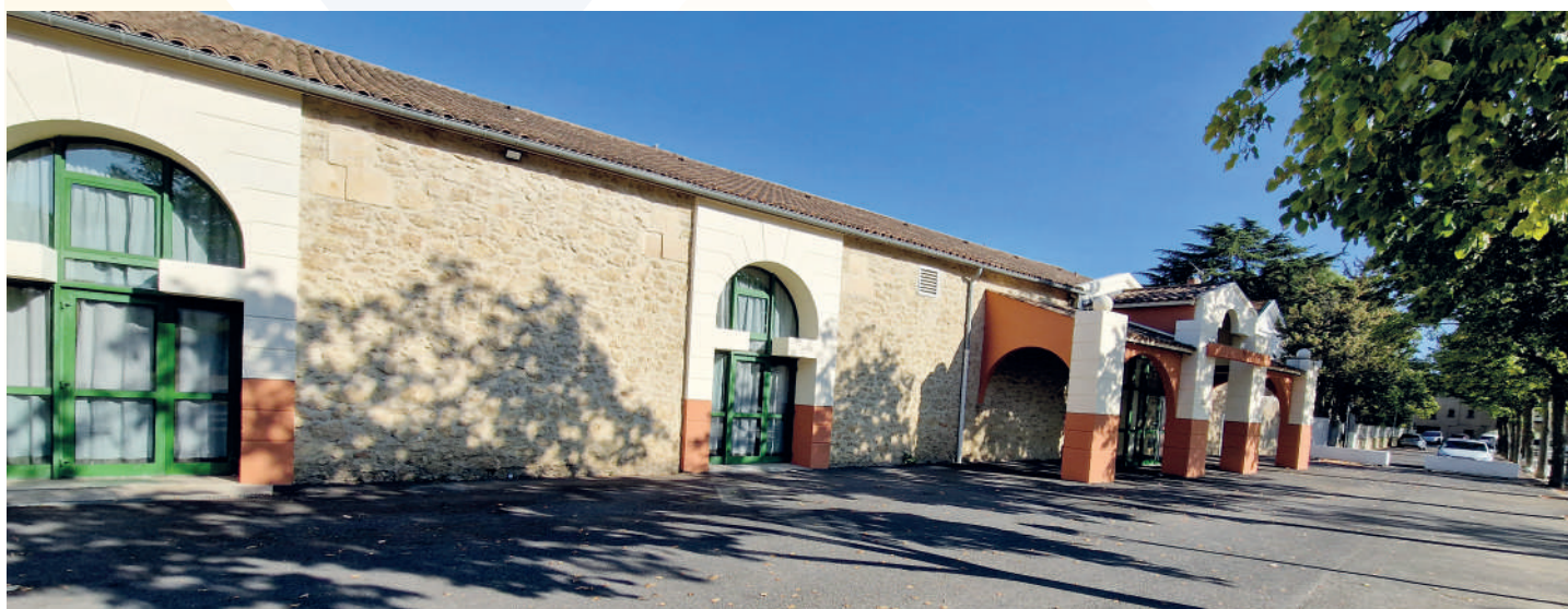
Rénovation Salle Polyvalente