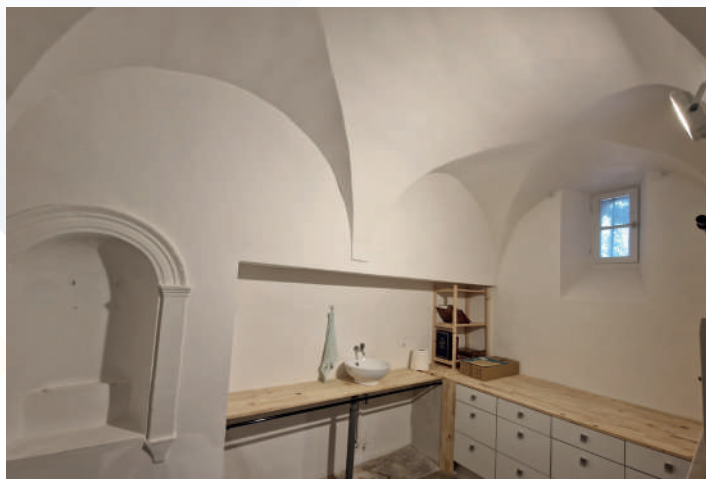
Rénovation de la Sacristie