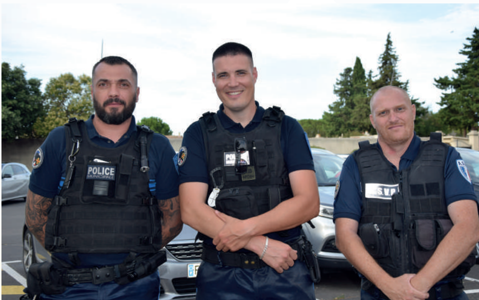
Les agents du service de Police Municipale

Les contrevenants s'exposent à verbalisation en vertu des arrêtés municipaux applicables.