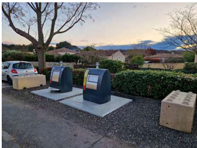
Point d'Apport Volontaire des déchets ménagers de l'avenue Achille Levère