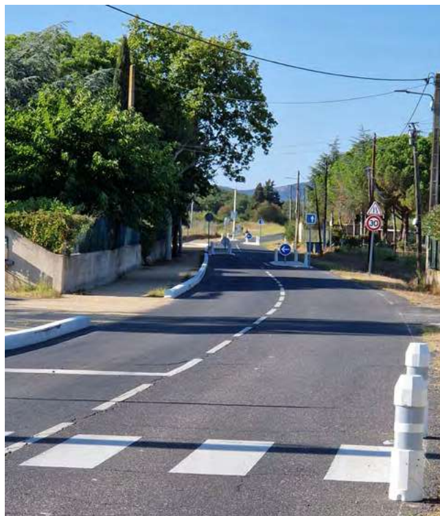
Voie douce sur RD 124

En bordure de l'avenue du stade (RD 124), nous avons aménagé le prolongement de la voie douce jusqu'à l'ancien stade. Un nouveau tronçon depuis l'ancien stade jusqu'au chemin des Barthes Hautes sera réalisé en janvier.