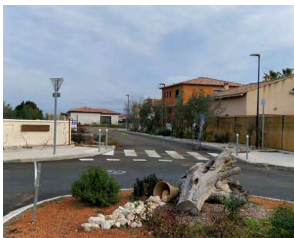
Le clos des vignes (5 lots)