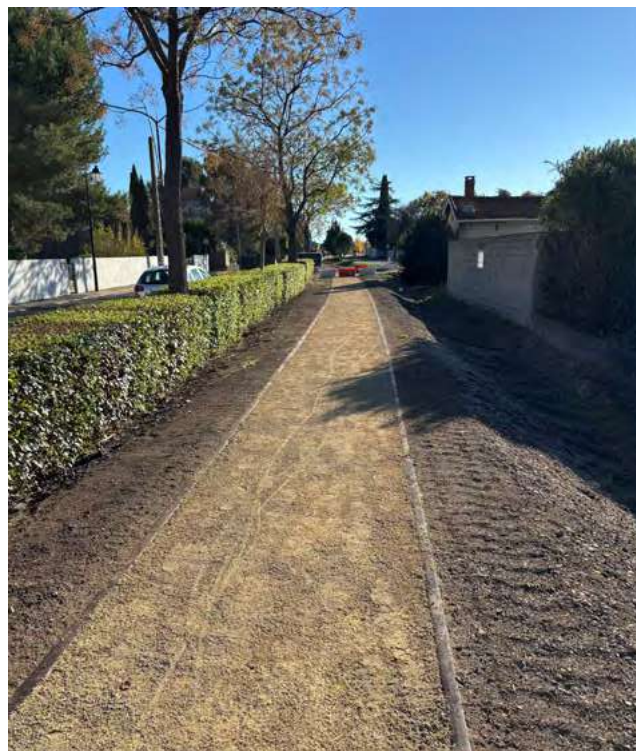
Voie douce vers le Guillaumant