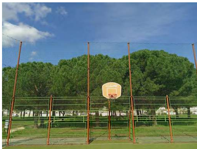
Entretien du City-stade