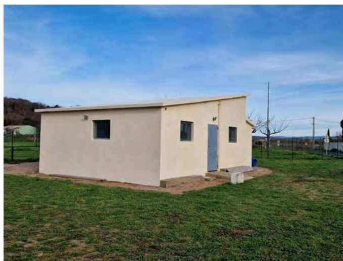
Local associatif, à l'ancien stade