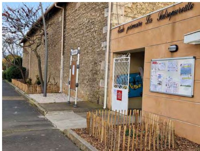
Platebandes près du groupe scolaire