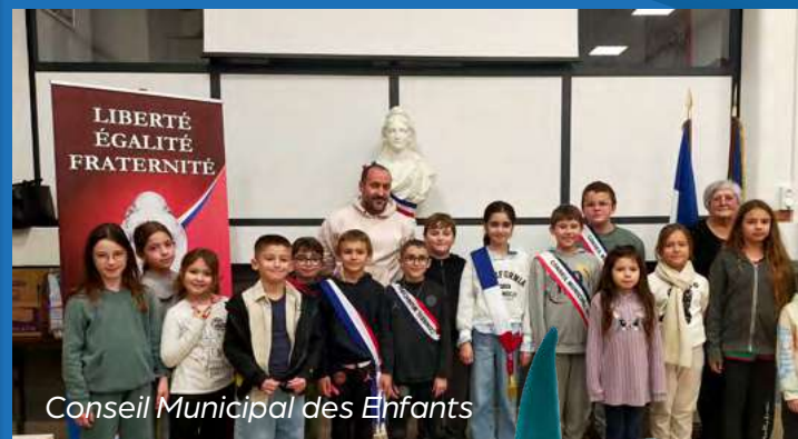
Conseil Municipal des Enfants