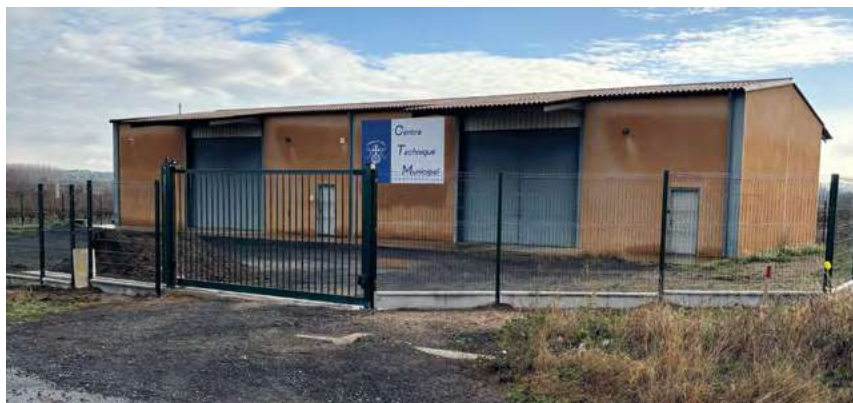
Centre Technique Municipal

Acquisition et aménagement du nouveau Centre Technique Municipal – enfin un bâtiment parfaitement adapté au garage des divers engins, véhicules de services et au stockage des fournitures courantes nécessaires aux activités quotidiennes de nos agents des services. Par sa localisation hors de la zone urbanisée il supprime les dangers et nuisances à proximité du groupe scolaire, de la salle polyvalente et du parking Les Baumes. Prochainement, des plantations de haie seront réalisées.