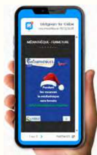
PANNEAU POCKET L'application