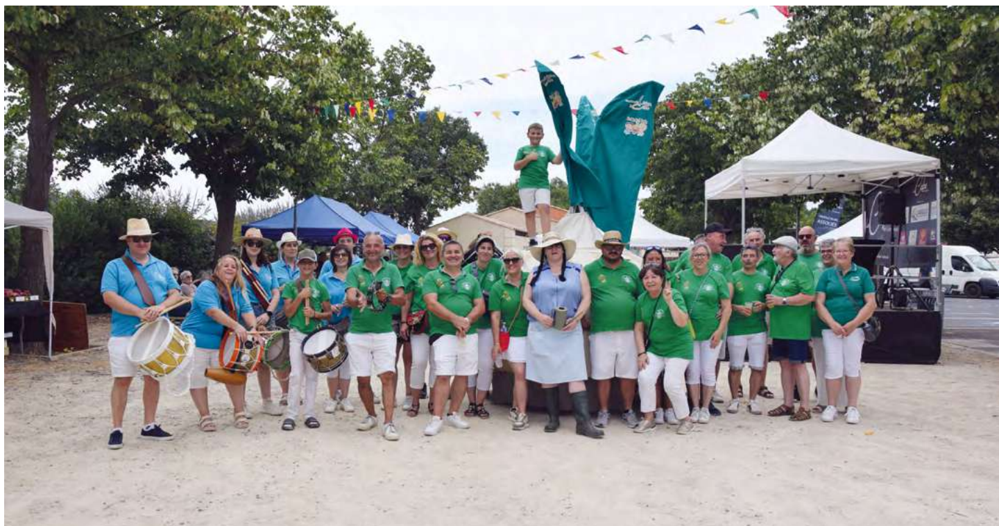
L'équipe de la Cébe Totémique avec le groupe Bleu Totem