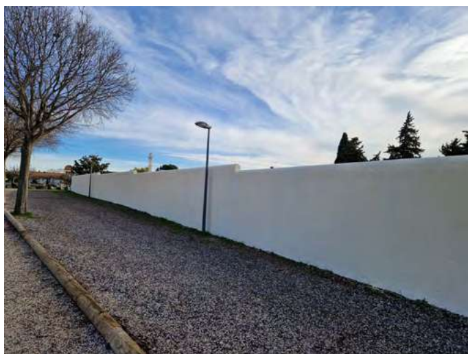
Mur du cimetière