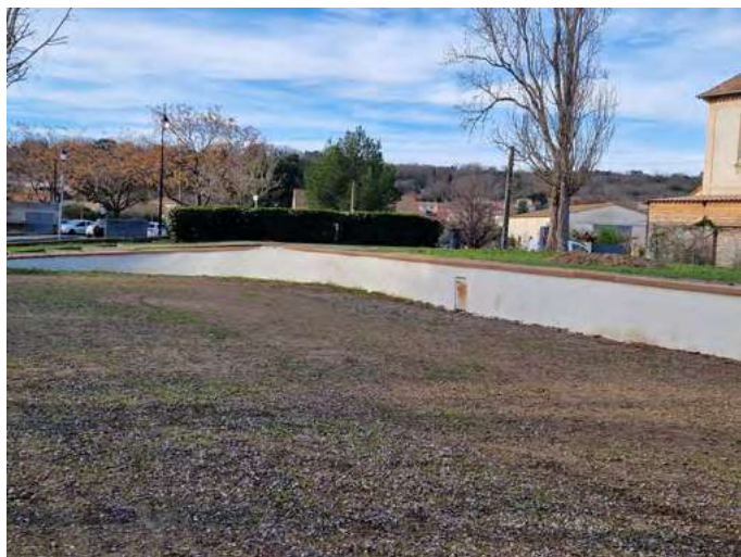
Quai de gare